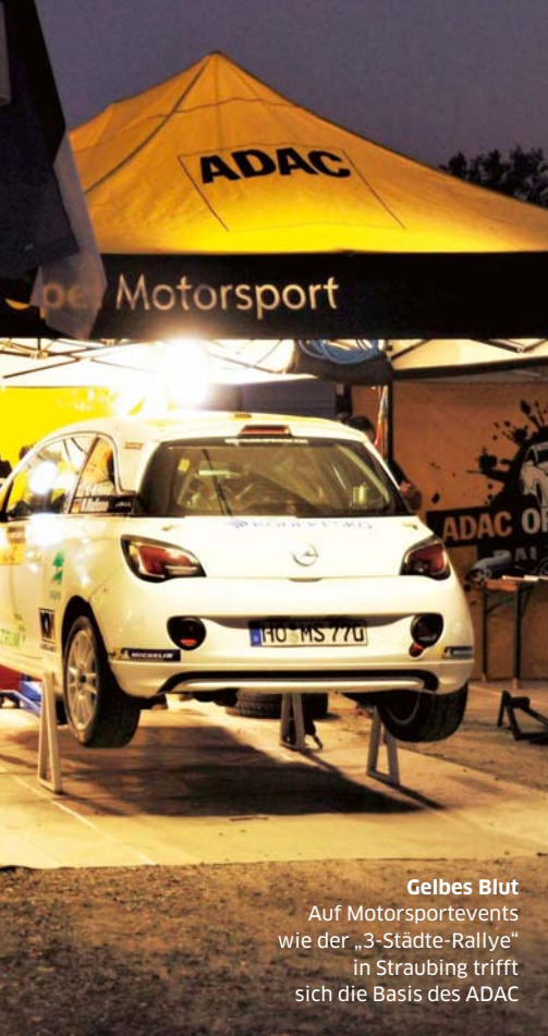
Gelbes Blut Auf Motorsportevents wie der „3-Städte-Rallye“ in Straubing trifft sich die Basis des ADAC